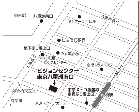
東京試験場案内図