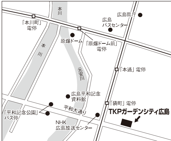
広島試験場案内図

ただし、障がい等のため自家用車による来場が必要である場合は、事前に島根県人事委員会事務局企画課任用グループまでご連絡ください。また、近隣商業施設への無断駐車はご迷惑となりますので、絶対におやめください。