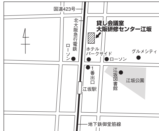
大阪試験場案内図