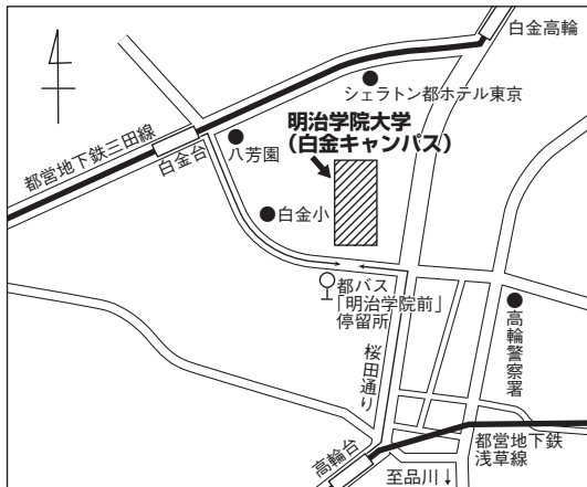
東京試験場案内図