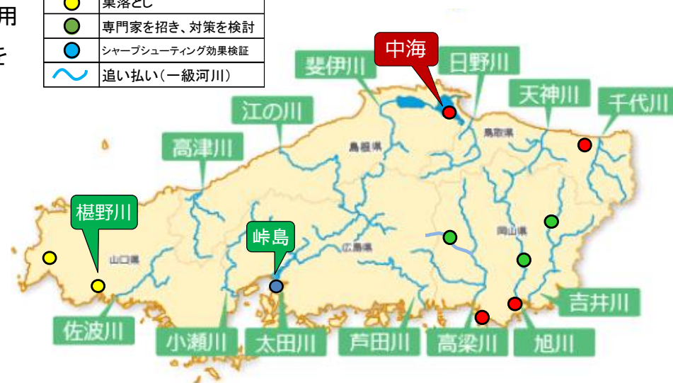
【カワウ対策の実施河川等】