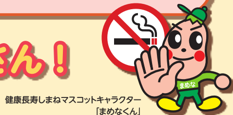
健康長寿まねマスコットキャラクター「まめなくん」

この煙を吸い込んでしまうことを受動喫煙といいます。また、この有害物質は目に見えなくなっても空気に残っています。