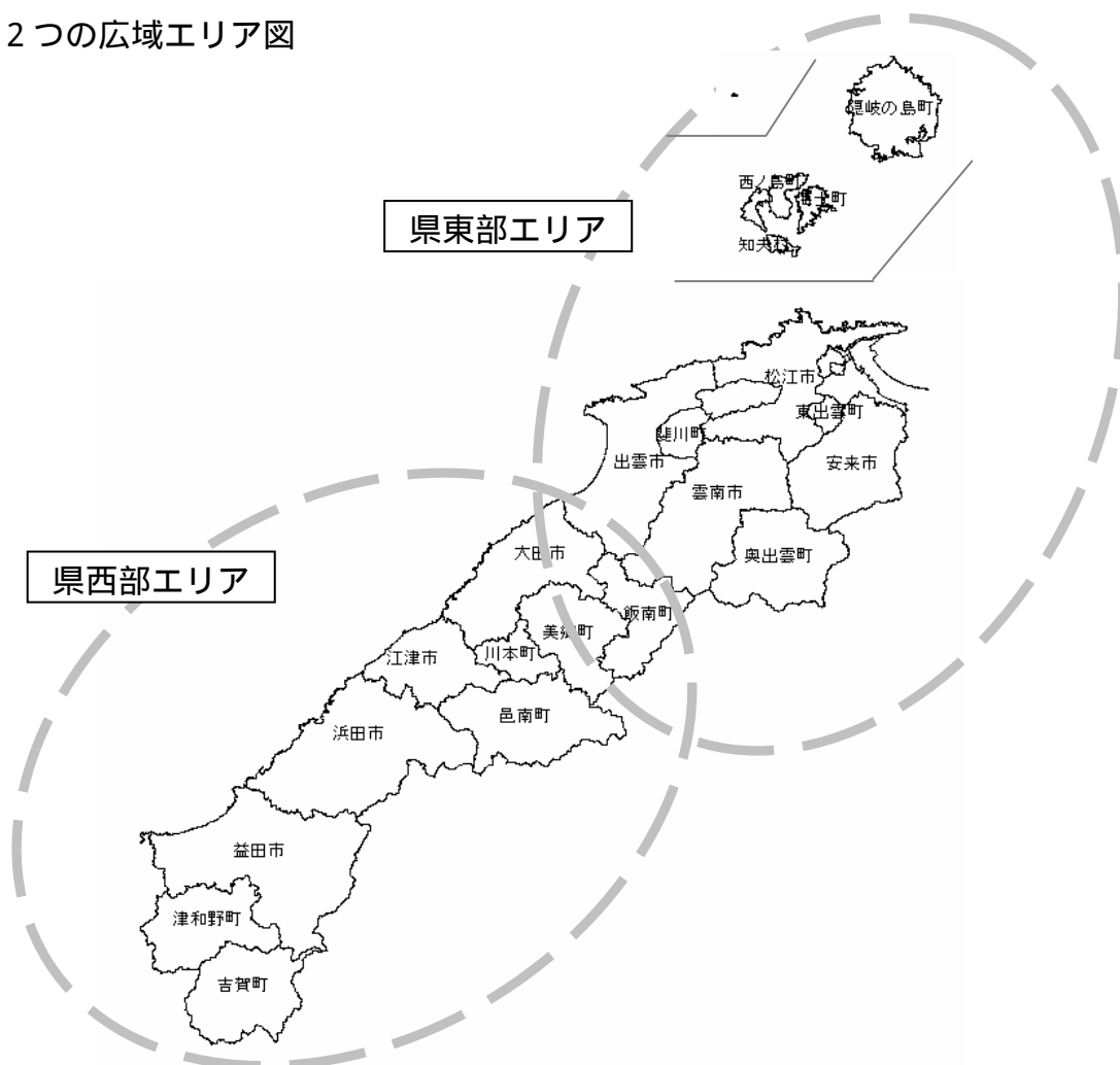
2つの広域エリア図