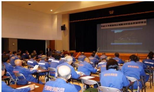
益田広域圏消防協会幹部研修会