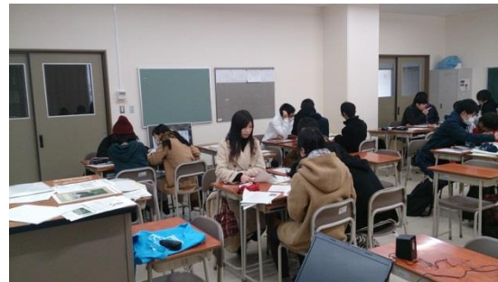
松江高専 土砂災害防止学習会