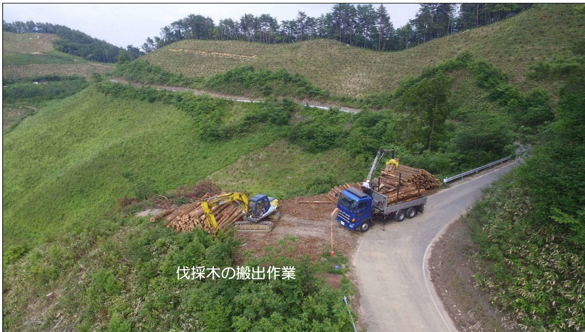
伐採木の搬出作業