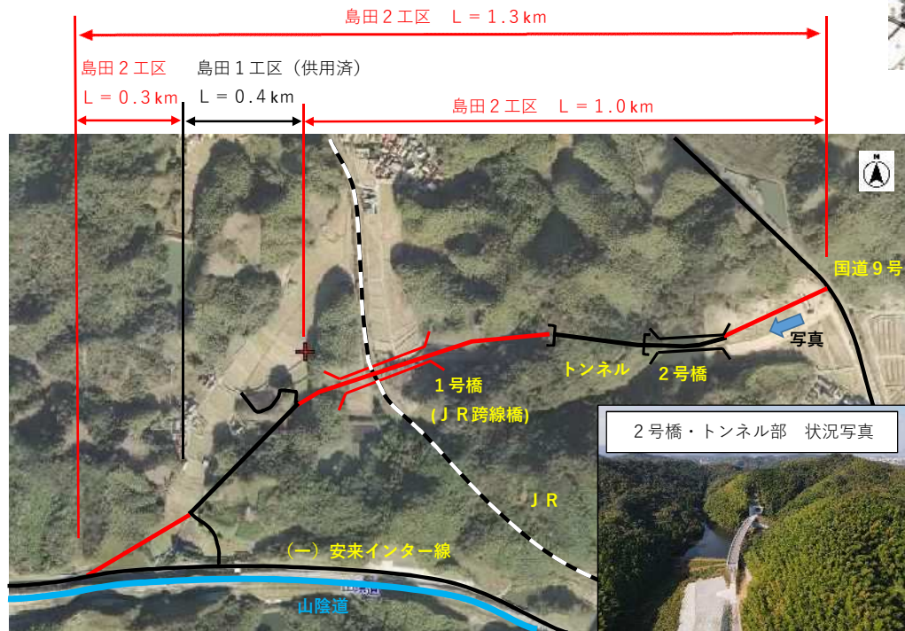
2号橋・トンネル部 状況写真