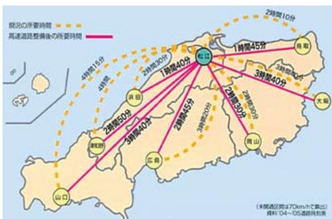
▲移動時間の大幅な短縮効果