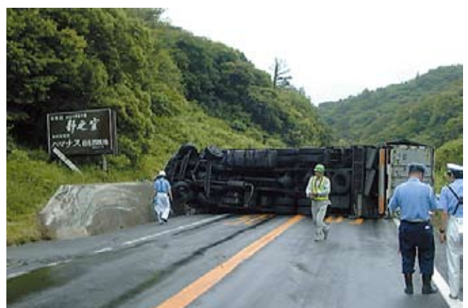
▲事故・災害時の代替道路として機能