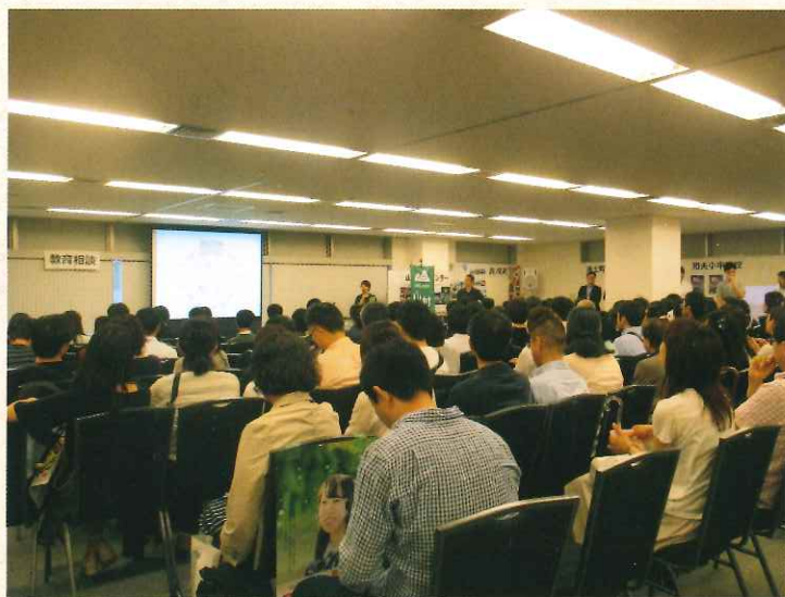
大田市山村留学センターによるしまね留学の説明会の様子

高校から始まったこの取り組みも、近年では 「小中学生のしまね留学」として、小学校・中学校