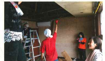
空き家の解体を体験している様子