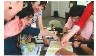
地域おこしのため会議をすすめている様子