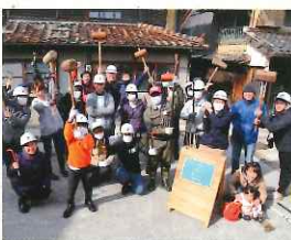
暮らし方研究所集合写真

地元を好きになれない気持ちがある今の仕事との出会いとなり、不思議なことに今その地元で地域づくりの仕事をしています。故郷を思う気持ちを大切にしていただけたらと思います。