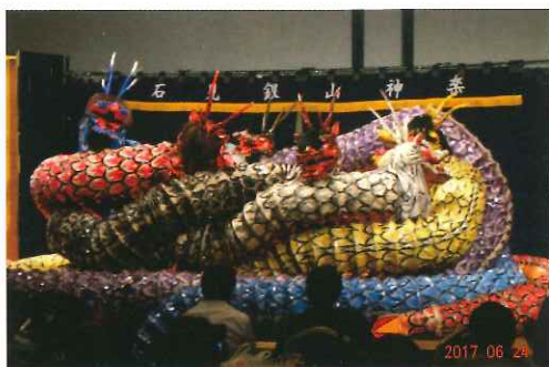
懇親会の石見神楽ステージ

いただくため、会員に限らずその家族の皆さんにも懇親会参加の門戸を開きました。ふるさとをもっと会員の皆様を知っていただく為、平成22年より懇親会へ石見神楽など地元文化を招致するとともに毎年ふるさとの海産物、ゆかりの物品販売等盛り沢山企画しています。来年は6月23日(土)近畿大田市人会懇親会を予定しています。大田市に縁のある方ならどなたでも結構です。是非一度参加してみてください。