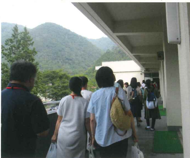
しまね留学説明会の様子

しまね留学とは島根県外に住んでいる意欲ある 中学生が、島根県の高校を受検し、入学し、島根県 で充実した高校3年間をおくることをいいます。 平成22年度から始まったこの取り組みは、現在 では県立高校19校に広がり、県外からの入学生も