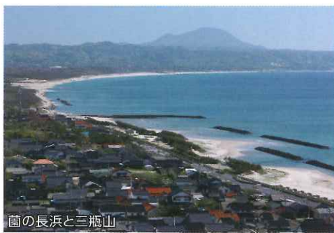
山の長浜と三瓶山

西方の海に弓なりに開く海岸線は、滑らかな砂浜から岩肌がむき出しの荒磯へとダイナミックに変化していきます。まさに神業に例えられるにふさわしい景観であるとともに、夕日の絶景エリアとして人々に愛されてきました。