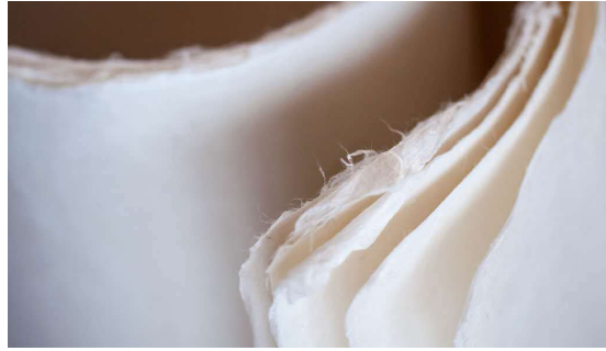
石州楮紙（文化財修理用紙）

石州半紙の歴史は1000年以上とも言われ、島根県の石見地方一帯に広まり、江戸時代には浜田藩、津和野藩で奨励され、日本各地に販売し普及した特産品として隆盛を極めた紙でした。明治、大正、昭和と時代の流れと社会の変化、近代化の波の中で衰退し、生活様式の変化と用途の変化で日本の和紙自体が激減する中、石州半紙もその道をたどってきました。