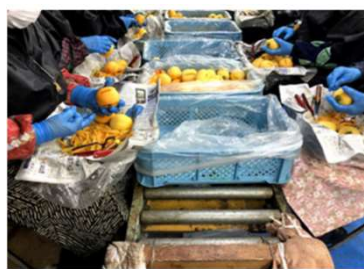
残った皮を手作業で取り除く