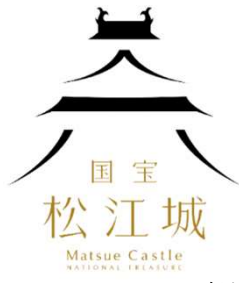
松江城のロゴマーク

松江市のシンボルである松江城は、戦国武将【堀尾吉晴】によって築城され、1611年に完成しました。全国に12しかない現存天守である松江城は、学術的な価値が高いことが評価され、平成27年7月8日、国宝に指定されました。来年は、国宝指定されて10周年のメモリアルイヤーとなります。松江市では、記念事業として、ロゴマークの作成や記念イベントの開催を予定しております。その中でもメインイベントとなるのが、毎年12月に横浜で開催されるお城好きの祭典「お城EXPO」の特別版「お城EXPO in 松江」です。令和7年6月28日、29日の両日、くにびきメッセで開催します。国宝5城サミットや城郭のある自治体が全国から集まる「城めぐり観光情報ゾーン」、人気の城郭研究者による講演などを予定しております。