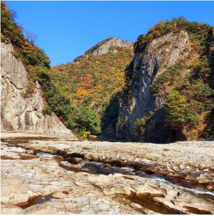
邑南町の名勝「断魚溪」

関西邑南会は広島県との県境にある邑南町の出身者会です。平成16年に石見町、瑞穂町、羽須美村の2町1村が合併し邑南町が発足いたしました。その後も元の町の故郷会である関西石見会、関西瑞穂会、関西はすみ会として独自に活動を続けてまいりました。しかし、各会の会員の減少等もあり、平成28年に3会が合併し関西邑南会として発足いたしました。