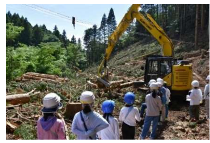
木材の伐採現場を見学

訪問前には、隠岐の島町への興味を深め、きっかけとして、現地の方から隠岐の島町の自然についてのお話を聞く事前学習の機会を設けました。