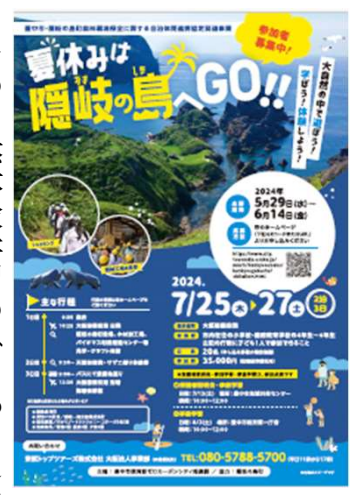
イベント募集チラシ

豊中市（以下、「本市」と）と隠岐の島町は、「森林環境保全に関する自治体間連携協定」を令和3年（2021年）10月に締結しました。同協定に基づき、両者で連携・協力して、豊かな自然に囲まれた隠岐の島町の地域特性を活かした自然体験学習を実施しているほか、隠岐の島町の森林における二酸化炭素吸収量を増加させるため、本市は森林整備に関する支援を行っています。