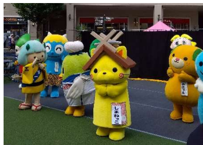
中四国9県観光物産展 みのおキューズモール 令和6年9月21日(土) ～23日(月)