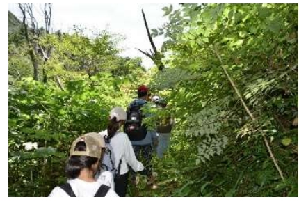
鷲ヶ峰にてトレッキング

現地では山仕事の見学や木質バリエーション、工場の見学、浜辺でのサザエ獲り体験など、住宅都市である本市ではできない貴重な体験ができました。