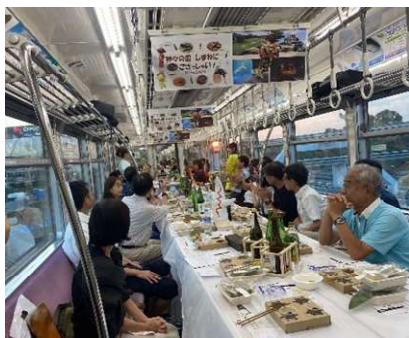
大阪モノレールの 日本酒列車& 観光物産展 万博記念公園駅 令和6年9月7日(土)