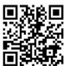
ホームページ QRコード

近畿島根県人会ホームページでは、 近畿島根県人会の紹介、活動報告、市 町村人会・県人会、お知らせ、イベン ト情報、縁結び美味しまね認証店等を 掲載しております。