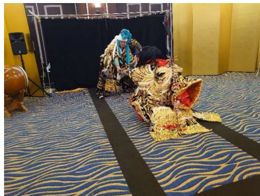
第9回邑南会総会・懇親会での石見神楽

当会の総会・懇親会においては石見神楽と地元物産展は付き物で、これが無いと総会への出席者が大きく減少することから、役員一同、会員の要望に応えるため、物産展においては人気の高い干しわかめや酢イカ、地元の醤油、漬物など必ず持参していただくよう、強く要望しております。神楽においては、各地区の持ち回りで来ていただいております、大変好評を得ております。