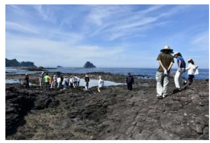
浜辺でサザエ獲り体験

令和6年度（2024年度）は、7月25日から27日までの3日間、20名で訪問しました。