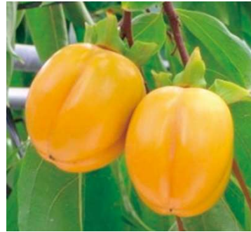
島根西条柿「こづち」