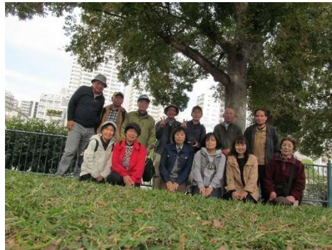
2020年秋のハイキング（大阪市内散策）

当会の総会・懇親会においては石見神楽と地元物産展は付き物で、これが無いと総会への出席者が大きく減少することから、役員一同、会員の要望に応えるため、物産展においては人気の高い干しわかめや酢イカ、地元の醤油、漬物など必ず持参していただくよう、強く要望しております。神楽においては、各地区の持ち回りで来ていただいております、大変好評を得ております。