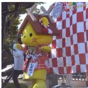
当地キャラ博 彦根市夢京橋 キャッスルロード 令和6年10月19日(土) ～20(日)