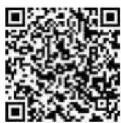
クラウドファンディングサイト【READYFOR】

クラウドファンディングサイト【READYFOR】にて、松江城国宝10周年で検索ください。