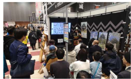
お城EXPO（横浜）で賑わう松江城ブース

また、より多くの方に「お城EXPO in 松江」にご来場いただくために、松江独自の特別企画も検討しており、多くの開催経費が必要となります。そこで、現在、クラウドファンディングによる支援を呼びかけております。