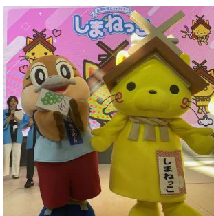
もずやん アニバーサリー2024 ららぽーと門真 令和6年9月8日(日)