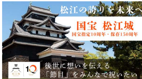
クラウドファンディング募集

また、より多くの方に「お城EXPO in 松江」にご来場いただくために、松江独自の特別企画も検討しており、多くの開催経費が必要となります。そこで、現在、クラウドファンディングによる支援を呼びかけております。