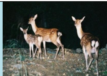
ライトセンサスで発見した母子グループ