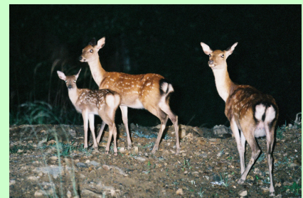
ライトセンサスで発見した母子グループ