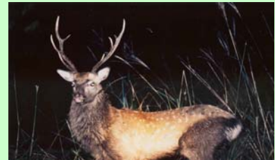
ライトセンサスで発見したオスジカ