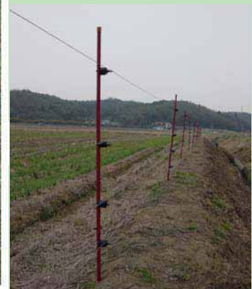
図 侵入防止柵の設置状況と目撃・被害状況(唐川調査地)