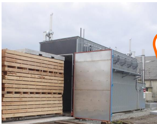
図-1 従来の化石燃料に依存した木材乾燥機

脱温暖化に向けた技術開発は、世界レベルにおいて緊急かつ共通の課題です。一方で現在の木材乾燥機の多くは、灯油や重油を熱源としているため、よりクリーンで安全な燃料が求められています。そこで、本県に多い中小規模製材工場が導入しやすい低価格で、これまでのような化石燃料を使用せず、太陽熱などの自然エネルギーを組み合わせ、低コスト・高品質で乾燥できる木材乾燥装置の開発をめざします。