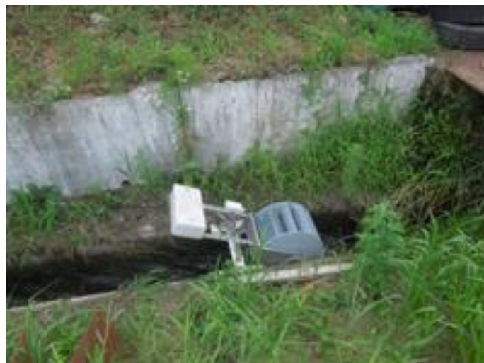
用水路に設置したマイクロ水力発電機