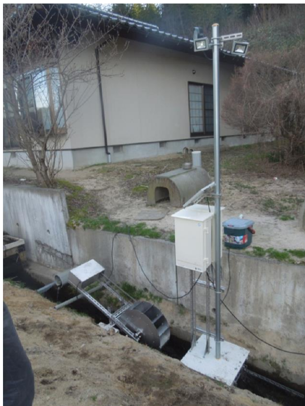
街灯用に設置したマイクロ水力発電機