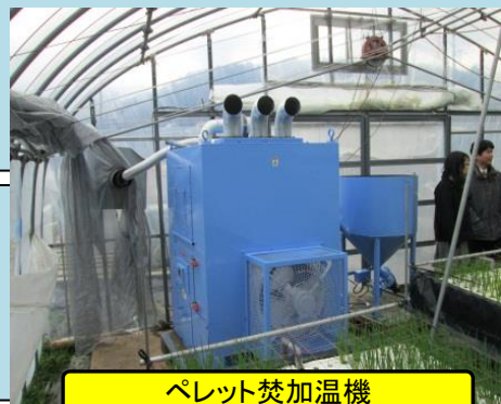
ペレット焚加温機

MOUNTAINOUS REGION RESEARCH CENTER 島根県 中山間地域研究センター