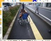
歩道面がV字状、直進しにくい