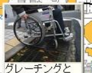
グレーチングと段差で滑る