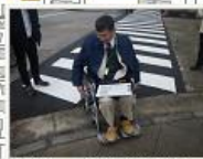
歩道への段差あり 後ろ向きで上がる