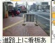
進路上に看板あり、直進できない