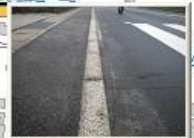
歩道のアスファルト面は、傾斜が多い