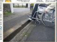
横断歩道を渡るとなぜか段差