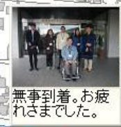
無事到着。お疲れさまでした。

避難安全確認マップ 一障がい者・外国人・高齢者・観光客も避難しやすい？ (101118)