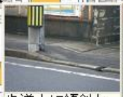
歩道上に傾斜と電柱が多い