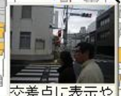
交差点に表示や自印はない