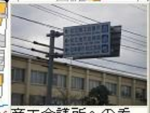
商工会議所への看板、英語あり