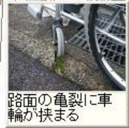
路面の亀裂に車輪が挟まる