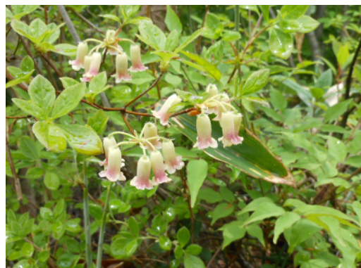
ウスギヨウラクの花

コース 明眼寺谷ルート…指谷山縦走路…指谷奥（1,047m） …指谷山（967m）・昼食…木地屋谷ルート… 作業道…100年杉展示林…ホテルもりのす前