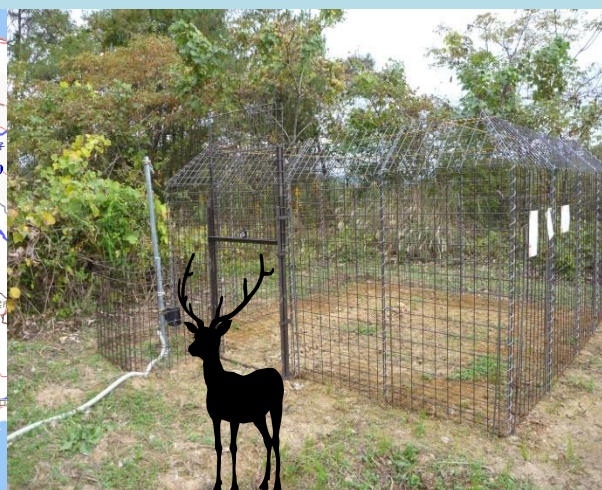
ICTシステムを使った捕獲装置