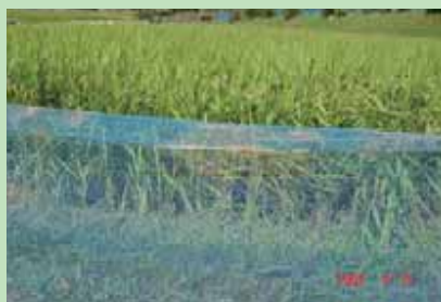
侵入を受けたネット柵