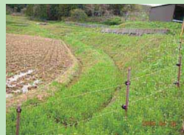
年中設置されている電気柵