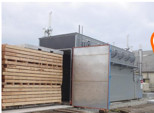
図-1 従来の化石燃料に依存した木材乾燥機

脱温暖化に向けた技術開発は、世界レベルにおいて緊急かつ共通の課題です。一方で現在の木材乾燥機の多くは、灯油や重油を熱源としているため、よりクリーンで安全な燃料が求められています。そこで、本県に多い中小規模製材工場が導入しやすい低価格で、これまでのような化石燃料を使用せず、太陽熱などの自然エネルギーを組み合わせ、低コスト・高品質で乾燥できる木材乾燥装置の開発をめざします。