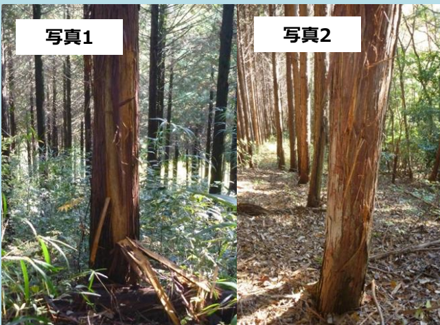
写真1 木部露出剥皮型の被害木