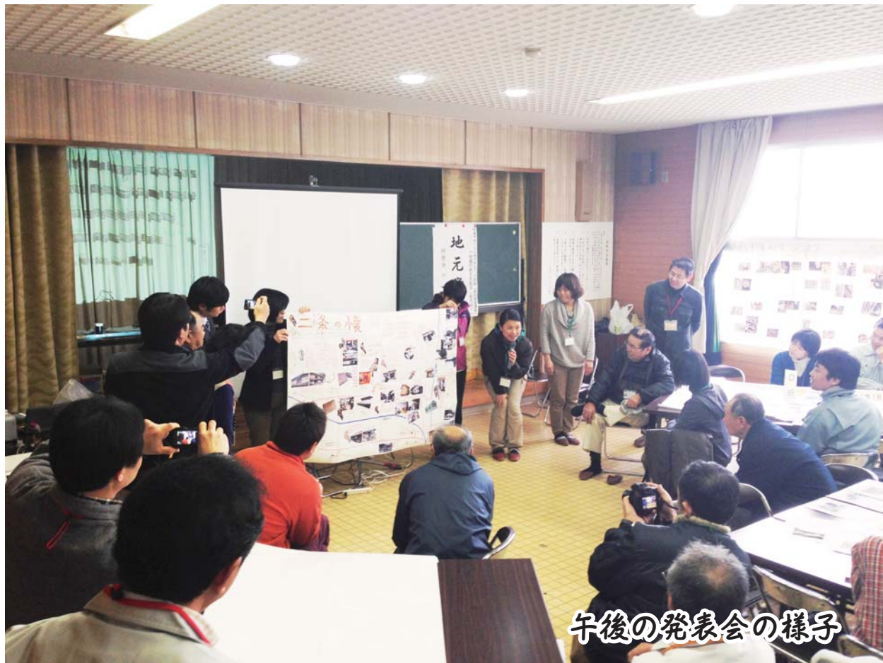
午後の発表会の様子