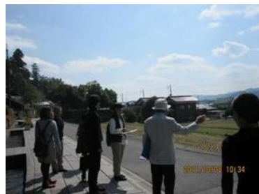
周南市鹿野地域での地域資源調査や情報発信の支援（専門知識提供型）