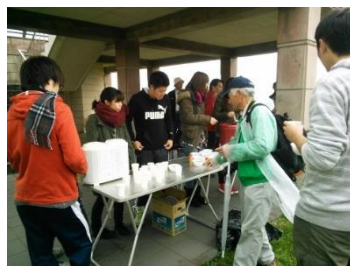
美祢市美東町赤郷地区でのイベント活動支援（交流型）