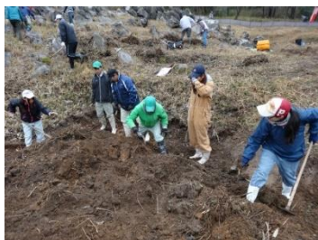
美祢市美東町赤郷地区での農地保全活動（労務提供型）