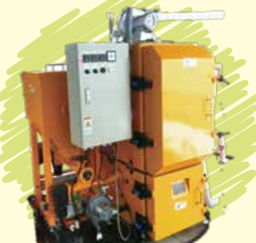
ペレット焚き温水ボイラー