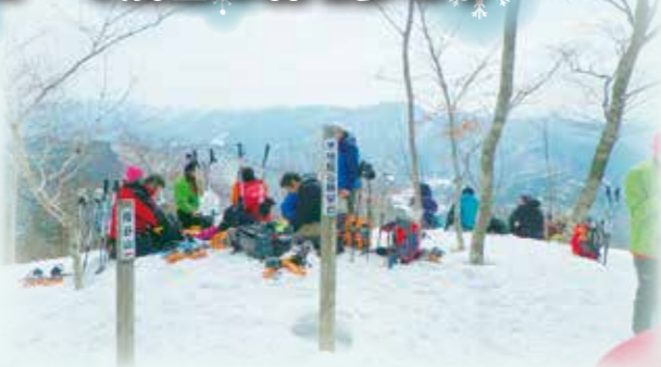
指谷山(標高967m)登山道など、歩行時間約4時間のコースを歩きます。 *スノーシューの貸出有り。