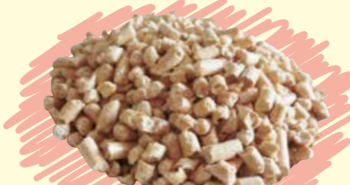
ホワイトペレット