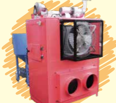
ペレット焚き温風機