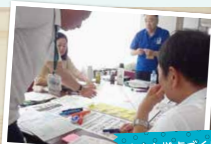
小さな拠点づくり