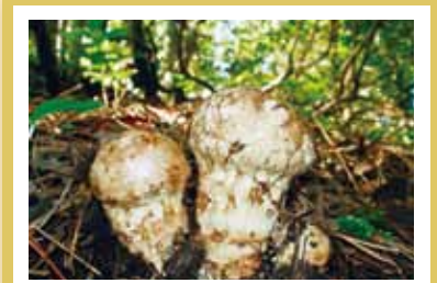
マツタケ 人気・知名度・プライスNO.1