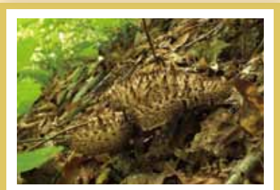
コウタケ 塩漬け品は香り倍増