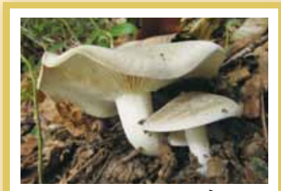
ホンシメジ 香り松茸 味しめじ