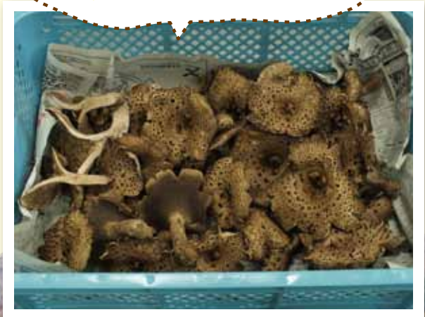
毎年、各地で見つかるコウタケ一度にたくさん採れるので感謝します。