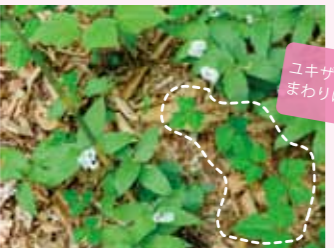
ユキササのまわりに!