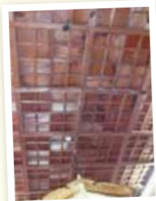
糞尿による白いシミ