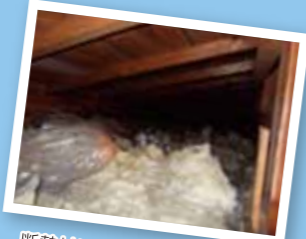
断熟材は建材に利用される