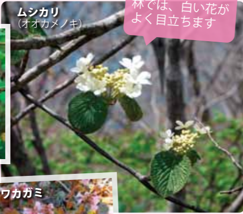
ムシカリ (オオカメノキ)