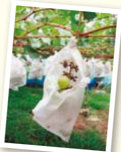
ブドウの房を上から食べる