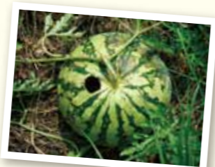
中をくり抜いて食べる

※【特定外来生物】もともといなかった国や地域に、人間の活動によって持ち込まれた外来生物のうち、農林水産業、生態系、人の生命・身体などに深刻な被害を及ぼす動植物が「特定外来生物」として指定されます。