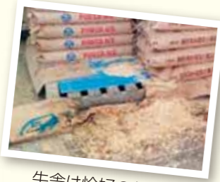
牛舎は恰好の餌場