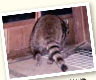
尻尾の縞模様が特徴

とくに被害と生息数の増加が深刻な益田市では、アライグマの生息に適したエリアを掲載しています。