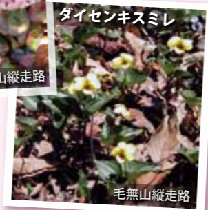
ダイセンキスミレ