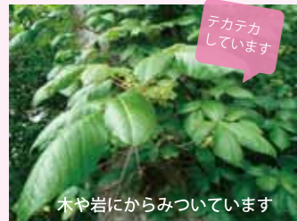
アカテカしています