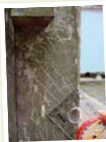
柱を登ると爪痕が残る