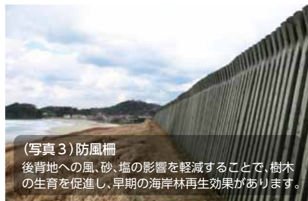
(写真3) 防風柵 後背地への風、砂、塩の影響を軽減することで、樹木の生育を促進し、早期の海岸林再生効果があります。