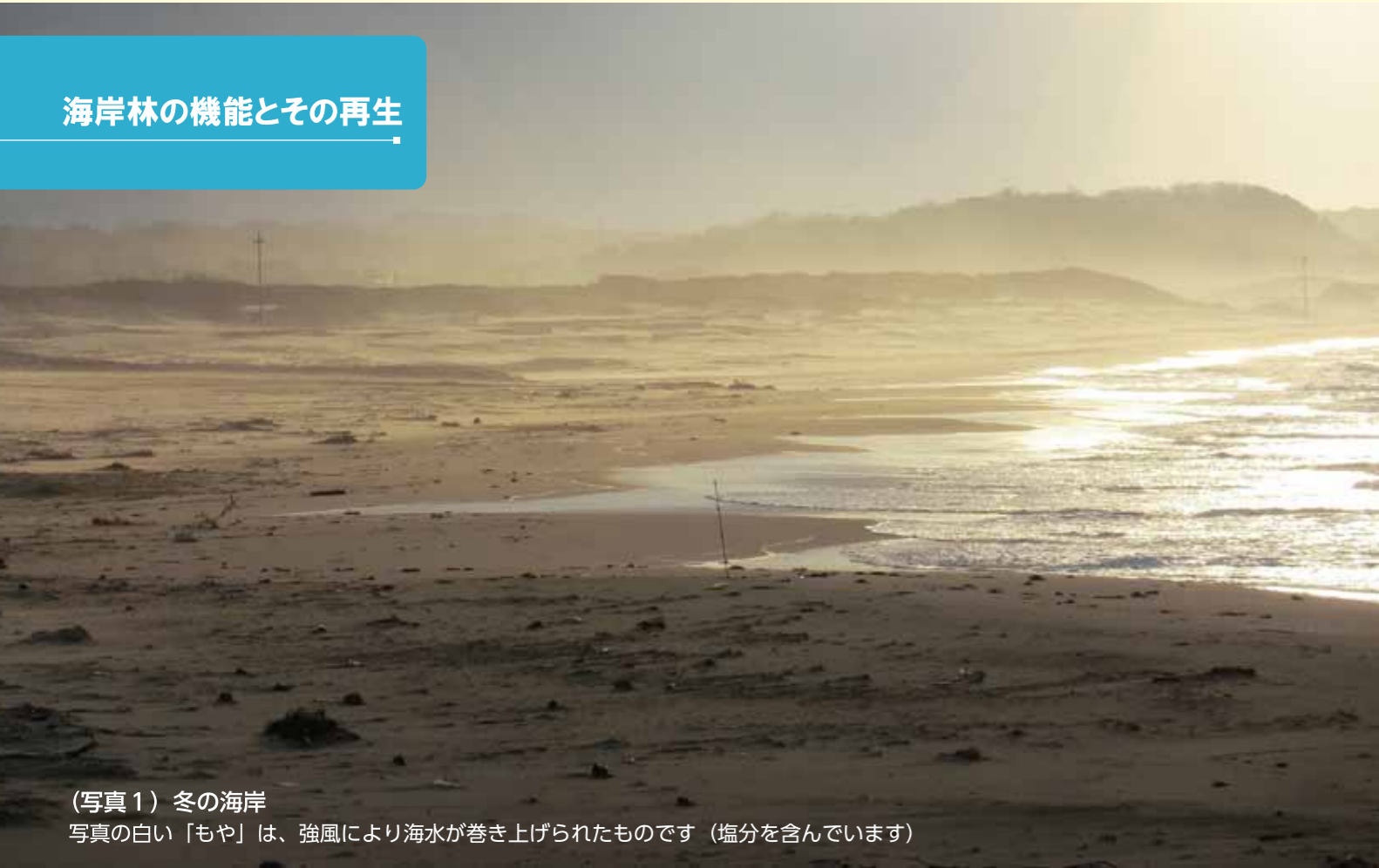
(写真1) 冬の海岸 写真の白い「もや」は、強風により海水が巻き上げられたものです（塩分を含んでいます）

島根県は日本海側に面し、冬は季節風の影響を強く受け、海岸には荒波が打ち寄せます（写真1）。しかし、この厳しい環境である海岸の砂地・岩石地などに発達した森林、つまり「海岸林」が私たちの暮らしを守ってくれています。