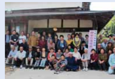
田舎の食体験ツアー参加者の皆さんと