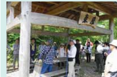
「上山佐名所めぐり」を開催！