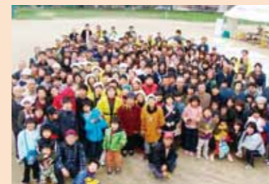
真砂地区の皆さん