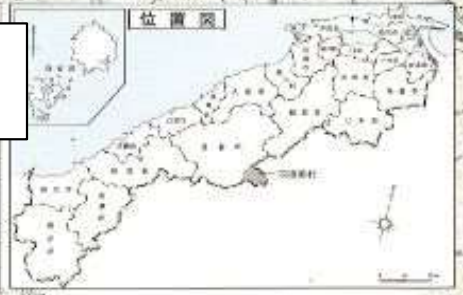
活性化計画区域と農泊に取り組む地域との関係図 島根県邑南町羽須美地区活性化計画