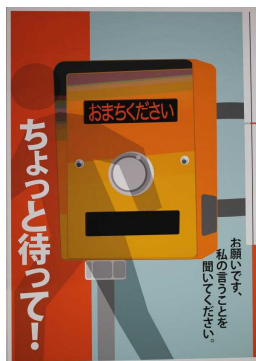
金本 歩実 さんの作品 島根県立東部技術校