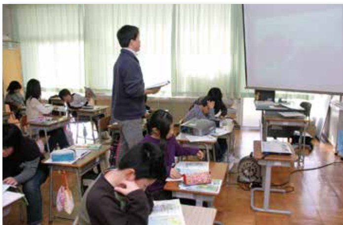
小学校で副教材DVDを使って行われる竹島学習

DVDは竹島の位置や韓国による不法占拠の状況、なぜ竹島に行けないのかといった基本的な知識に加え、漁場としての竹島や日韓暫定水域の問題点といった応用的な問題までわかりやすく解説しています。