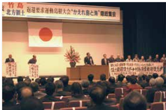
返還要求運動島根大会（2003 年 11 月）

1987（昭和 62）年には、官民で組織する「竹島・北方領土返還要求運動島根県民会議」が設立されました。また、島根県議会有志により 2002（平成 14）年 10 月に「竹島領土権確立島根県議会議員連盟（竹島