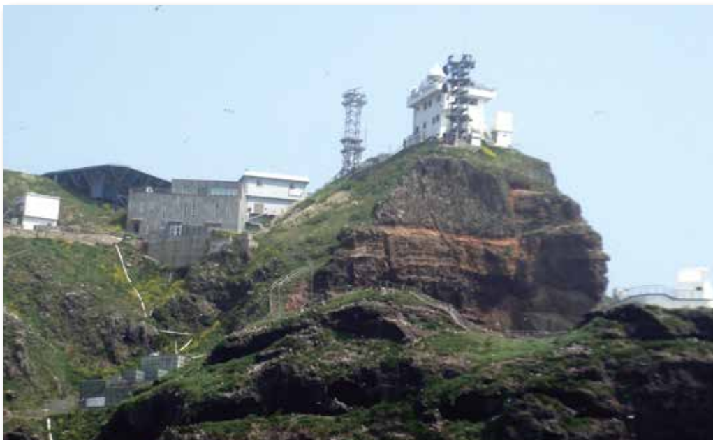
東島にある韓国の施設（2008 年撮影）

韓国は実力支配を強めるために警備隊の宿舎や漁民の住宅、通信施設やヘリポート、護岸整備を進めています。なお、昭和初期まで竹島に大群がいたニホンアシカは、現在絶滅したとみられています。