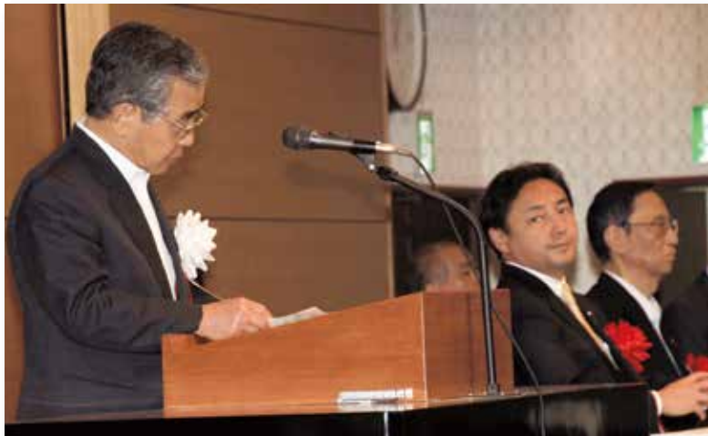
第 2 回目の東京集会での溝口善兵衛知事（左）、後藤田正純内閣府副大臣＝当時＝（右から 2 人目）（2014 年 6 月 5 日）

県民会議と領土議連は 2014 年 6 月 5 日、2 度目となる東京集会を実施しました。自民党と公明党の連立