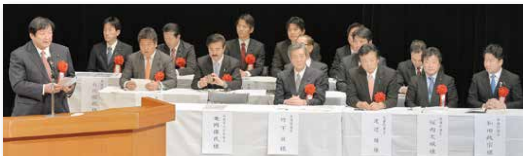
「竹島の日」記念式典で政府を代表してあいさつする亀岡偉民内閣府政務官＝当時＝（左）と出席した国会議員ら（2014 年 2 月 22 日）

2014 年 2 月 22 日の「竹島の日」記念式典にも内閣府政務官が出席。溝口善兵衛知事は「領土・主権対策企画調整室」の設置や竹島を日本固有の領土と明記した学習指導要領解説の改訂など一連の取り組みを評価した上で、政府主催の式典開催や「竹島の日」の閣議決定などを求める要望書を、政府代表として出席した亀岡偉民内閣府政務官＝当時＝に手渡しました。