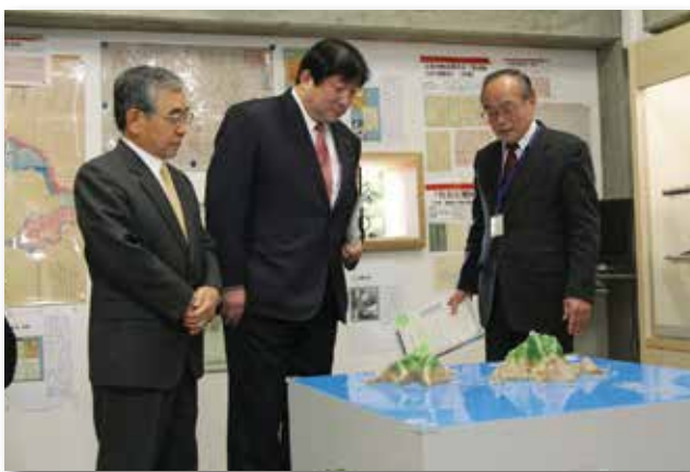
溝口善兵衛知事（左）とともに竹島資料室を視察する 亀岡偉民内閣府政務官＝当時＝（2014年2月22日）

2014年には竹島資料室に研修室を併設させ、島根県が定期的に専門家を招いて開催する「竹島問題を考える講座」の会場や団体客の研修場所として活用されています。島根県内を中心に開催される竹島問題についての研修会や集会にも積極的に講師を派遣して、啓発に努めています。同年2月22日の「竹島の日」には、亀岡偉民内閣府政務官＝当時＝が政務三役として初めて竹島資料室を視察しました。