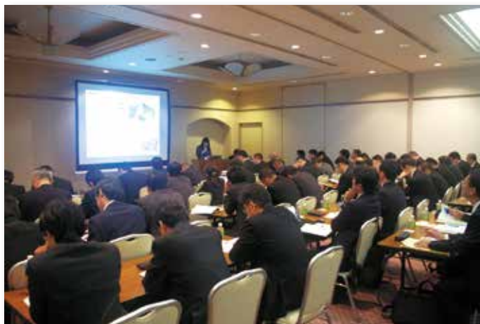
全国の指導主事を集めて島根県内で行われた研修 (2014 年 10 月、内閣官房領土・主権対策企画調整室提供)

島根県が蓄積してきた竹島に関する学習の先進的な取り組みが全国に広がろうとしています。