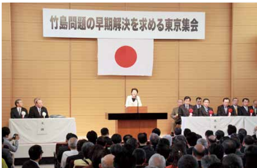
約 800 人が参加した第 1 回目の竹島問題の早期解決を求める東京集会（2012 年 4 月 11 日）

政府から山口壮外務副大臣と長島昭久首相補佐官（いずれも当時）、政党代表 8 人のほか、国会議員 63 人（うち代理出席 29 人）が参加。計 709 人と、会場に入りきれないほどの人が集会に集まりました。