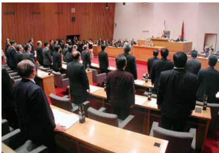
竹島の日を定める条例案を起立表決する島根県議会議員（2005年 3 月 16 日）

同年 5 月には竹島議連と県民会議が竹島の領土権確立と政府内の所管部署設置や啓発活動を求める国会請願を衆参両院に提出しました。条例制定は、竹島の地元から膠着する問題に大きな一石を投じる契機となりました。