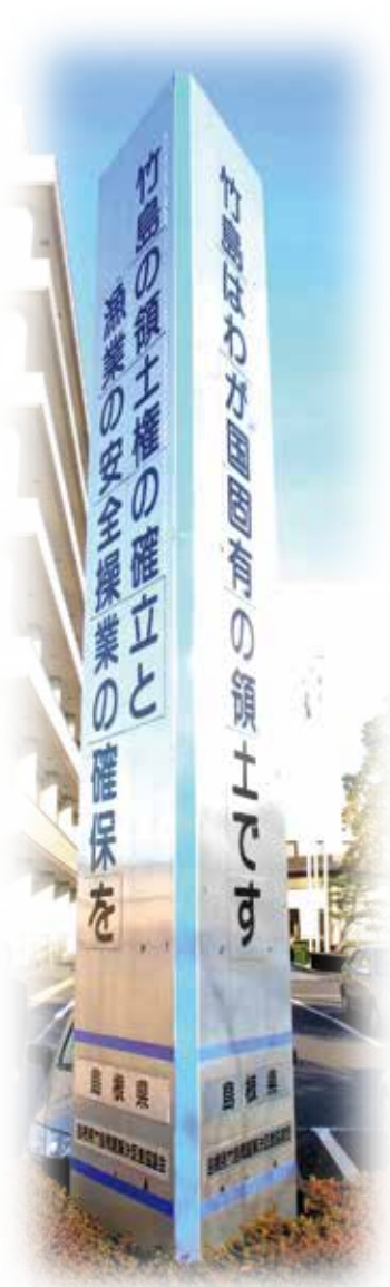
出雲空港に設置されている広告塔