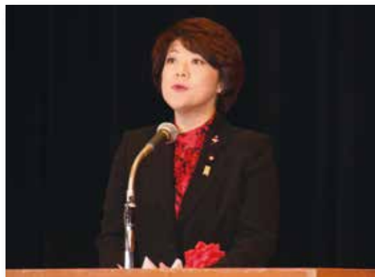
「竹島の日」記念式典に出席し、政府の見解を説明する島尻安伊子内閣府政務官＝当時＝（2013 年 2 月）

関する有識者懇談会」を組織します。竹島や尖閣諸島の領土について、日本の主張を国民や世界に効果的に広める方法を検討しました。7 月にまとめた最終報告書では竹島について国内世論の啓発が極めて重要とし、世論調査などの実施や教育現場との連携の必要性が明記されました。