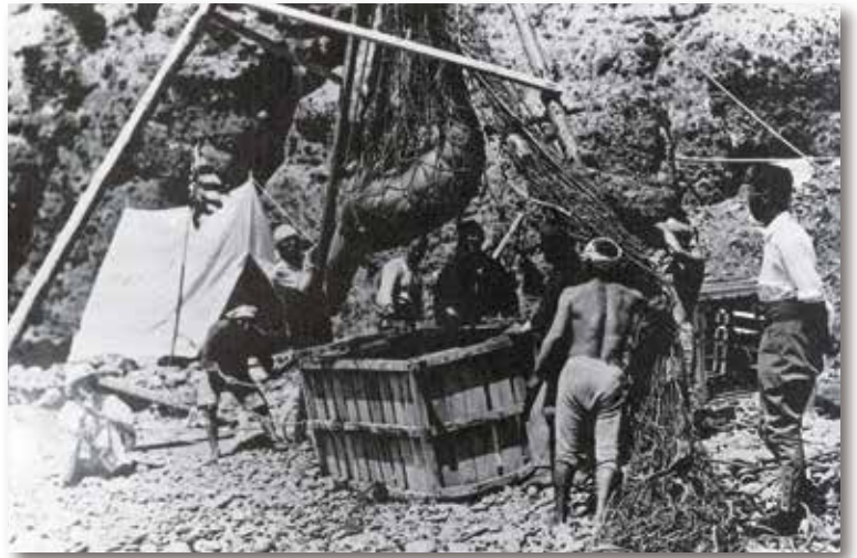
1935年ごろ竹島で生きたアシカ鯨を入れる漁師

竹島での漁鯨は昭和に入っても続けられましたが、第二次世界大戦の戦況悪化で中断しました。