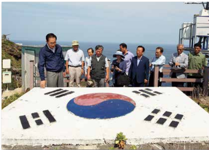
韓国の大統領として初めて竹島に上陸した李明博大統領＝当時＝（左端）

2012（平成 24）年 8 月 10 日、韓国の李明博（イミョンバク）大統領＝当時＝は鬱陵島からヘリコプターで竹島に着陸しました。歴代の韓国大統領で初めて竹島に上陸し、約 1 時間かけて記念碑や施設を視察しました。李大統領は「独島（トクト、韓国が主張する竹島の名称）は、真にわれわれの地だ。命をかけて守る価値がある。誇りを持って守ろう」と語り、警備隊員らを激励しました。日本に対しては前日に通告するという唐突な上陸は、全世界で報道され、特に日本社会に大きな衝撃を与えました。