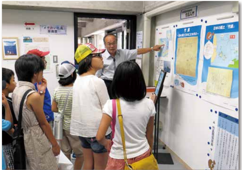
2013年8月、夏休みの子ども向け企画展でにぎわう竹島資料室

子供たちにも関心を持ってもらおうと、2013年度からは夏休み限定で子供向けの展示も始めています。子供たちにはクイズ形式で資料室にある展示物や地図を読み取ってもらい、楽しみながら竹島の基礎知識が身に付くプログラムにしています。引率する保護者にも好評で、夏休みの行事として話題を呼んでいます。