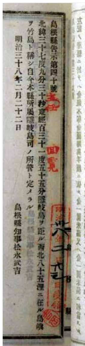
1905年2月22日に竹島の日本領土編入を受けて出された島根県告示の文書

竹島をめぐり、現在も朝鮮半島の2国が領有権を主張する根拠の一つにしている事象に江戸時代の「元禄竹島一件」が挙げられます。