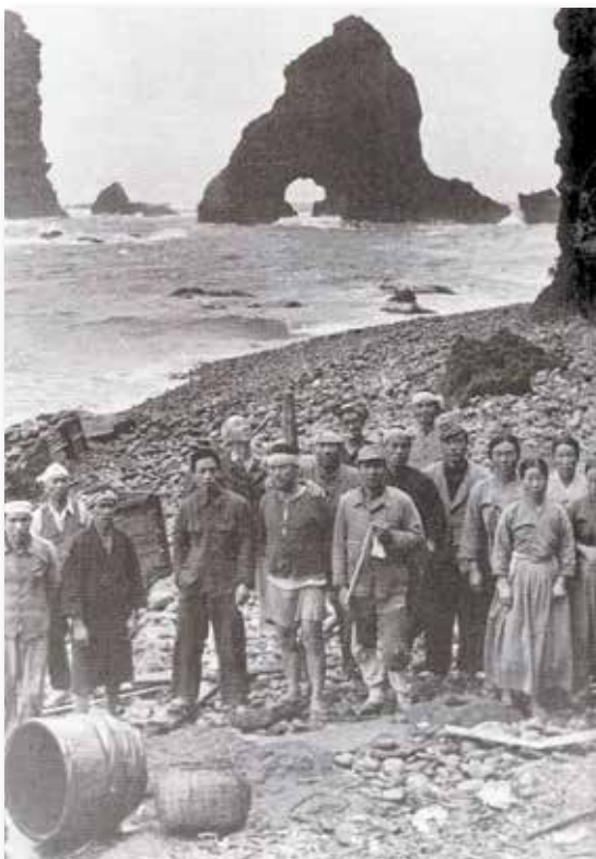
1935年ごろ、竹島へ渡ったアシカ鯨の一行