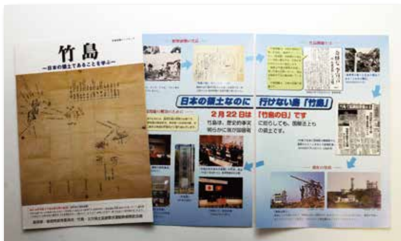
竹島学習リーフレット

リーフレットはA4判カラー、8ページの折り込みで、写真や図を用いたわかりやすい内容になっています。県内の小・中・高・