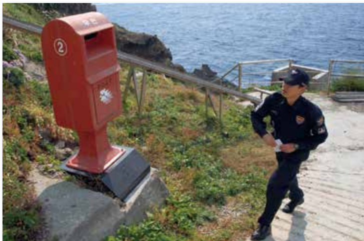
竹島に設置しているポストに投函する韓国の警備隊員

2006（平成 18）年には海上保安庁が竹島周辺で海洋調査を実施しようとしたしましたが、韓国側は警備艇を非常配備して緊張が高まりました。