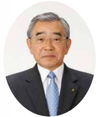
島根県知事 溝口 善兵衛

平成 17 (2005) 年 3 月 16 日、島根県議会において「竹島の日を定める条例」が可決され、平成 27 (2015) 年 2 月 22 日で 10 回目の「竹島の日」を迎えることとなりました。