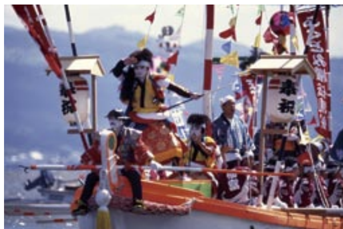
日本三大船神事と言われるホーランエンヤ。華やかで勇壮な時代絵巻が繰り広げられる

大都市ではお城の堀を潰して道路にしてしまったのですが、塩見縄手にはお堀を始め中世の武家文化が色濃く残っています。日本三大船神事の一つと言われる「ホーランエンヤ *1 」や、古く