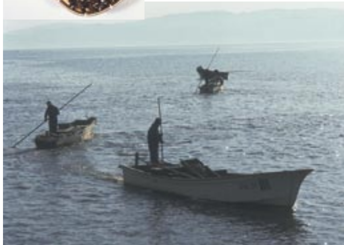
全国約48%の漁獲量を誇る宍道湖のしじみ