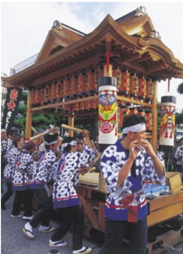
市内を練り歩く鑿行列の様子