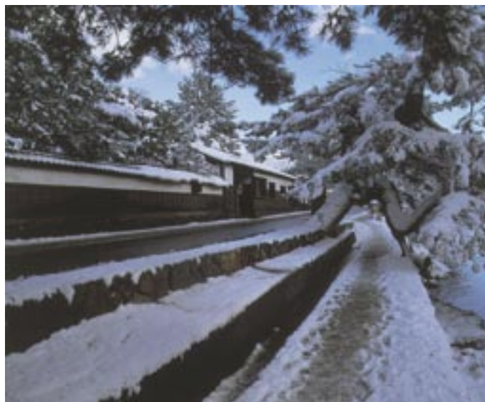
江戸時代の武家屋敷が並ぶ塩見縄手

私は鹿島町で鮮魚仲買・水産加工業を営んでいますが、知事がおっしゃられたように、島根半島沖は暖流と寒流がぶつかるところで、魚種も豊富で、魚の活きも締まりも良いのでブランドとして発信しています。最近ではJF島根が魚食普及に取り組んでおり、