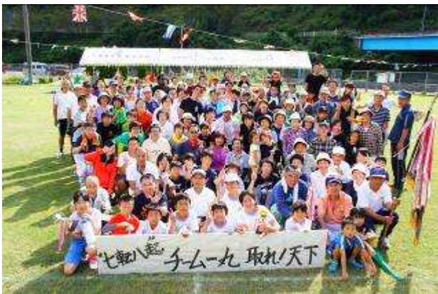
(運動会後集合写真)

開会後は用具係として競技の補助を行い、また選手としてもいくつかの競技に参加した。