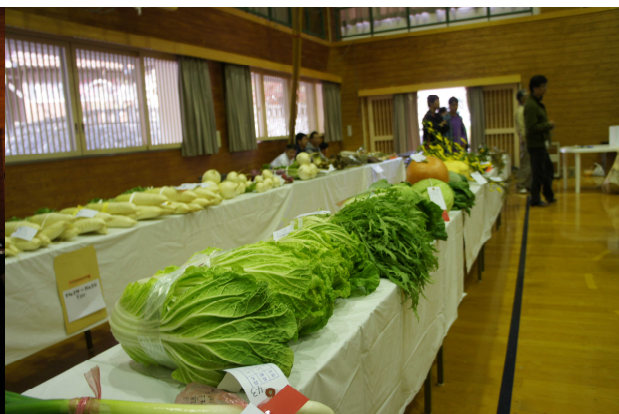
(農産物品評会の出品物)