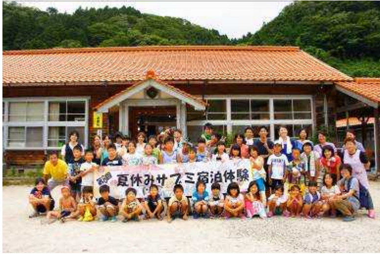
(宿泊体験集合写真)