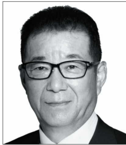
代表 松井 一郎