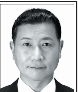
よしかず たるい 良和 元衆議院議員 表現の自由を守る・ 日本V字回復やったるい