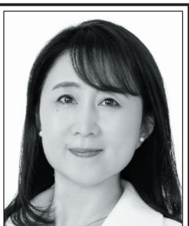
やた わか子 国民民主党 副代表 あなたと動けば、 未来は変わる。