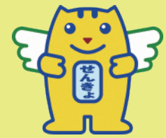
明るい選挙のイメージキャラクター「選挙のめいすいくん」