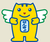
明るい選挙のイメージキャラクター「選挙のめいすいくん」