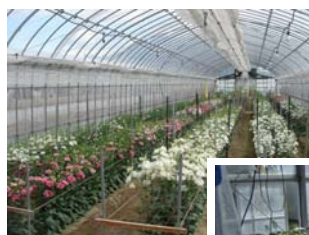
トルコギキョウの 品種比較