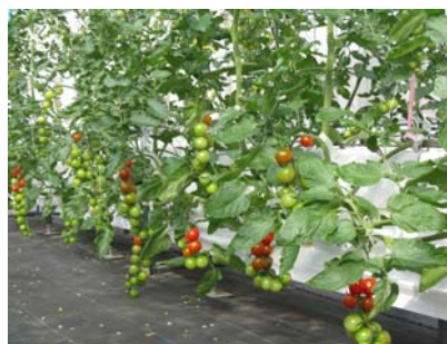
島根型養液栽培システムを用いた ミニトマト栽培