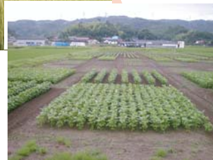
大豆低コスト生産の ための試験栽培