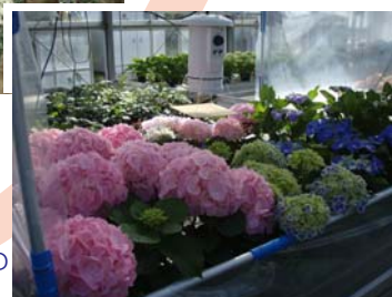
変温温暖房によるアジサイの 燃料削減試験