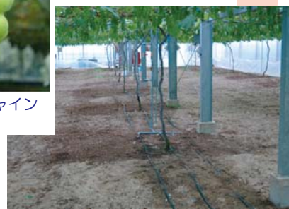
ブドウの点滴チューブによる 養液土耕栽培