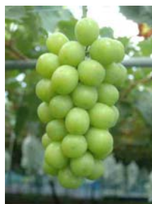
新品種 'シャイン マスカット'