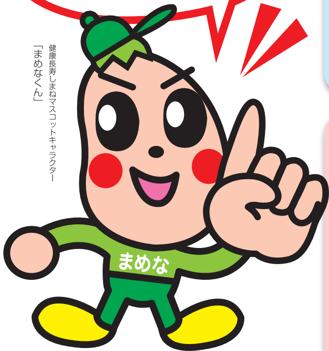
健康長寿しまねマスコットキャラクター 「まめなくん」

たばこに含まれる「ニコチン」は 依存性が高く、 「自力でなんとかしよう」 「意思を強く持とう」と考えても 禁煙は難しいものです。 一人で悩まず、各種サポートを 利用しましょう。