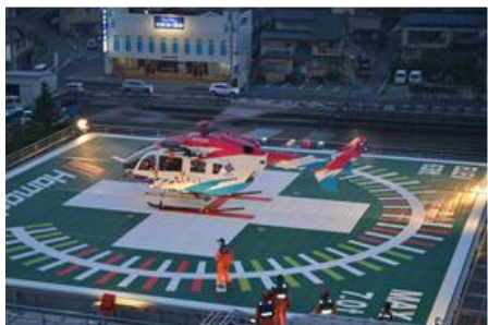
夜間防災ヘリ訓練

分娩については年間500例以上を扱っています。手術件数は約2300件です。緩和ケア病棟は15床で、地域がん診療連携拠点病院として重要な役割を果たしています。当院は国立病院機構全国143施設、中四国グループ