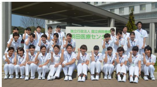
今年度採用新卒者 28名

看護単位は10単位(救命救急センター、一般病棟5部署、回復期リハ病棟、緩和ケア病棟、手術・中材、外来)で固定チームナースングを行っています。勤務体制は一般病棟では二交替勤務(12時間)で、救命救急センターのみ三交替勤務です。看護の施設基準は10対1看護でしたが、6月から7対1看護が取得できるようになりました。これは昨年から平均在院日数の短縮、看護必要度の適切な評価、亜急性期病床の適正運用等に力を入れ、今年度病床管理部門を強化し、7対1看護施設基準取得に向けた病床管理を行った結果だと思えます。今後は施設基準を満たすためにも、看護部の役割を果たして行きたいと思えます。