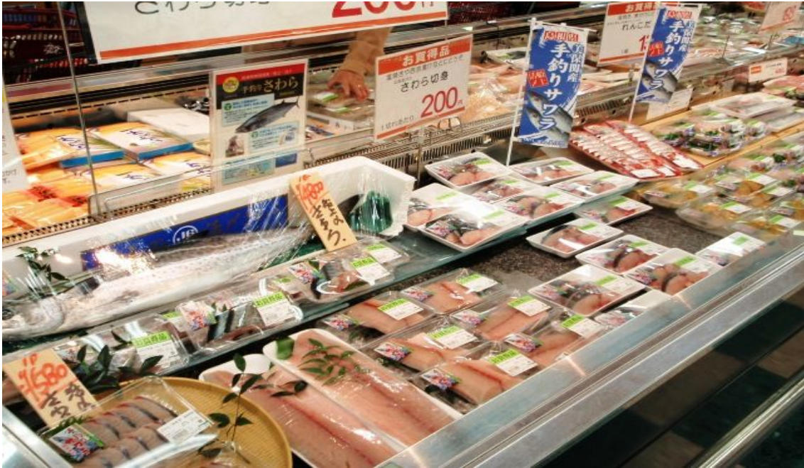
図7 美保産活メさわらが並ぶ量販店の鮮魚コーナー