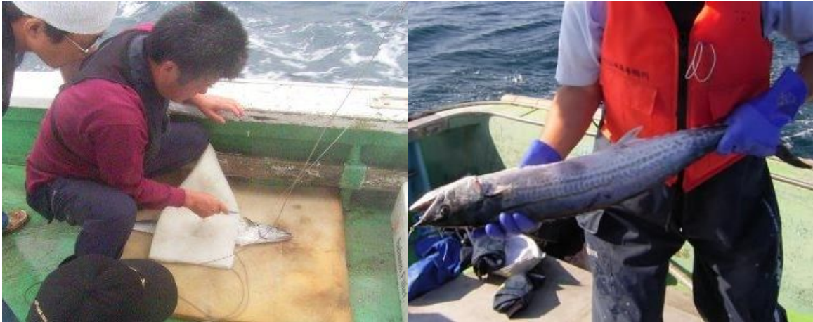
図3 サワラの扱い事例（左：スポンジ上で活〆・血抜き、右：両手でサワラを抱える）