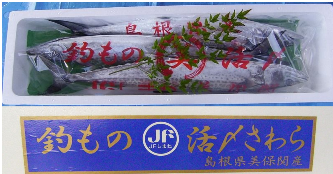
図4 美保関産活めさわらの荷姿（施氷前）と魚箱のステッカー