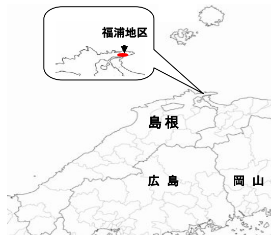
図 1 美保関町福浦地区の位置

私たちの福浦地区は美保関町の南側、山陰最大の漁港である境港と境水道を挟んで向き合う位置にある。（図 1）