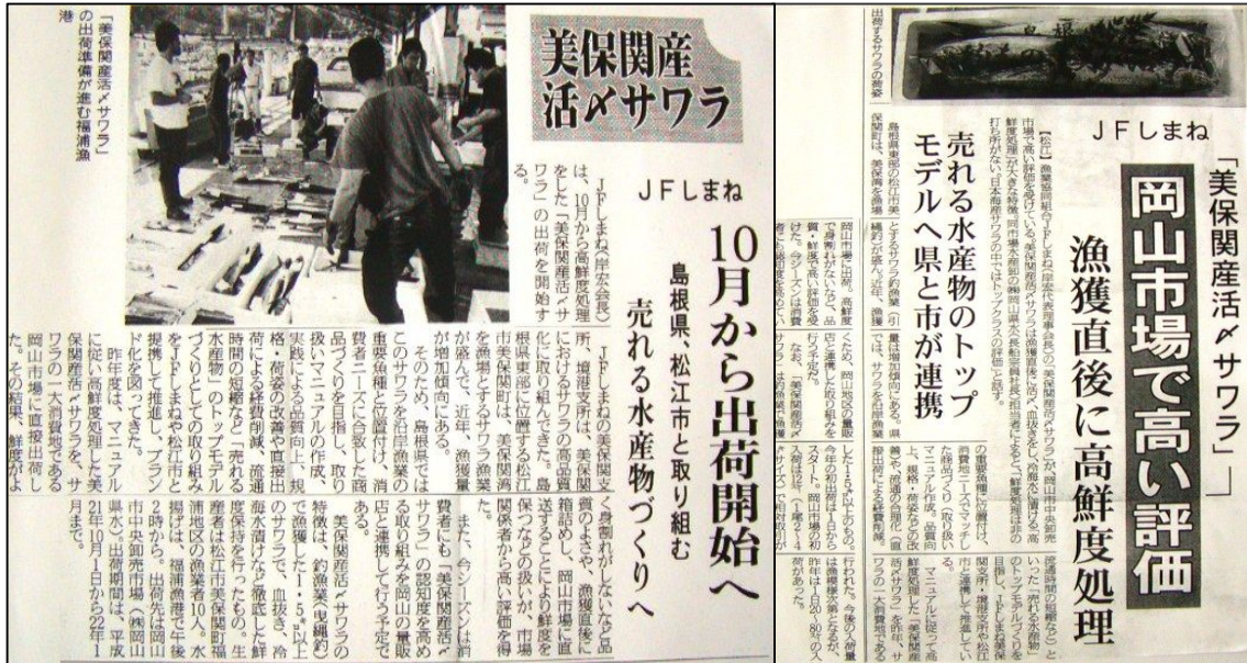
図6 取組みが紹介された新聞記事の一部

での高評価や認知度が得られたことを実感した。不景気等による消費低迷のなか魚価は下落傾向であるが、今年度も美保産活メサワらは地元市場より高値で取引されている(図6)。