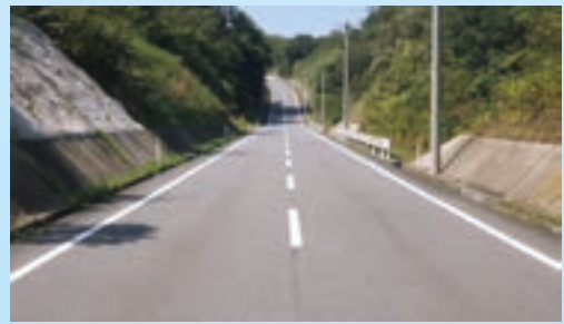
安来市広瀬町富田