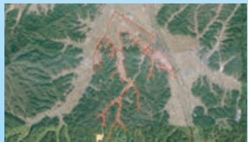
安来市大塚町、鳥木町