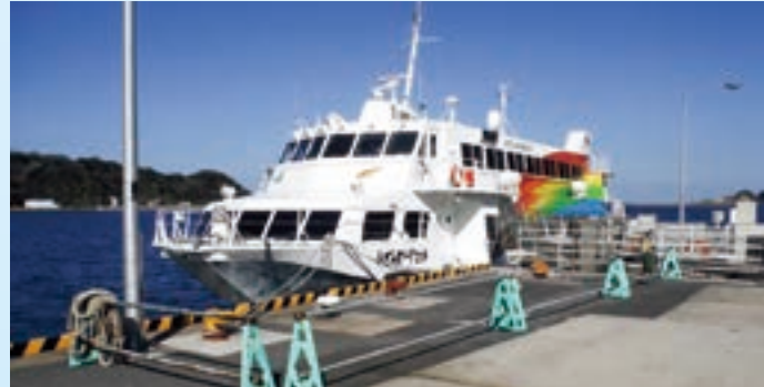
松江市美保関町七類