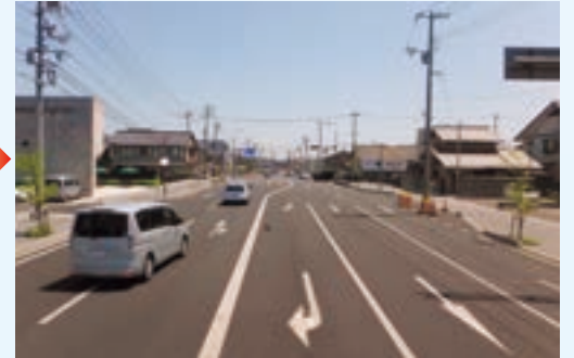
松江市殿町～南田町