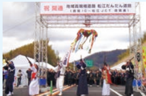
平成24年3月24日開通式