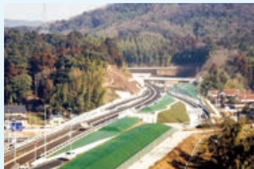
西尾インターチェンジ付近（松江市西尾町）