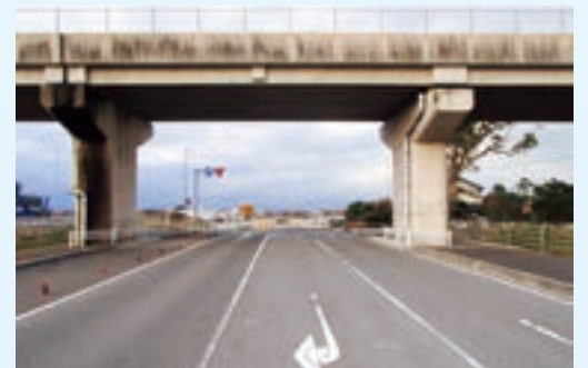
安来市飯島町～切川町