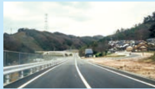
松江市八雲町西岩坂