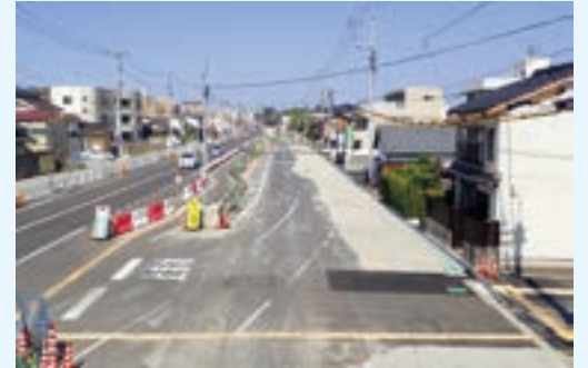
松江市南田町～学園南2丁目