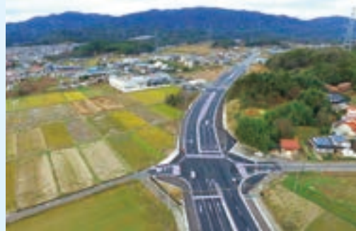
松江市上東川津町～下東川津町