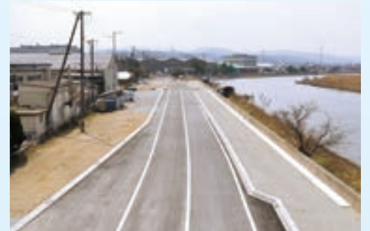
松江市東出雲町損屋