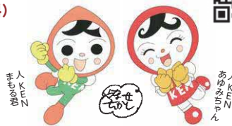
人権イメージキャラクター

(対応言語/英語・中国語・韓国語・フィリピン語・ポルトガル語・バトナム語 ネパール語・スペイン語・インドネシア語・タイ語)