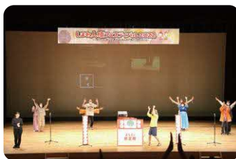
よしとさんの多文化ステージ