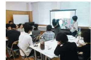
うんなん多文化共生推進委員会の様子

雲南市では外国出身者や関係者からなる「うんなん多文化共生推進委員会」を開催していますが、生活者としての外国出身の方が口にするのは次の二点です。一つ目は「日本人と同じように普通に接してほしい」こと。そして二つ目は「あいさつしてほしい」ということ。外国語で自分から先に話しかけるといのはとても勇気があることに違いありません。まずは私たち日本人が勇気を出して自分たちからあいさつをしましょう。きっと嬉しそうに、少しはにかんだ顔であいさつが返ってくると思います。そして、それらの積み重ねが、豊かな地域、誰にも優しい多文化共生社会をつくっていくに違いありません。