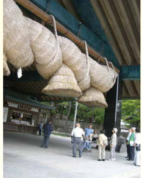
出雲大社参拝(出雲市大社町)

里帰りに参加できない療養所入所者の皆さんにお会いするため、療養所を訪れて交流活動を行ったり、歴史を学んだりしています。