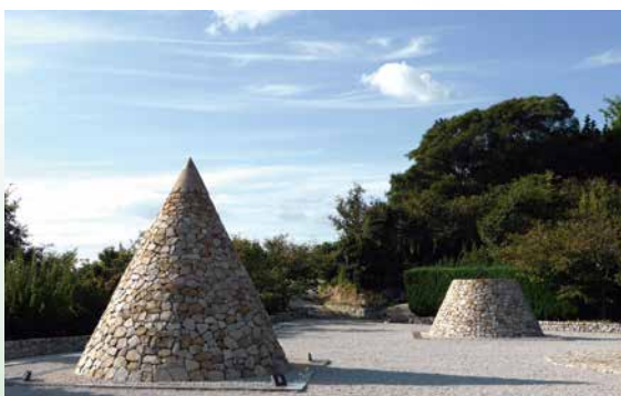
●大西さんの川柳です

棧橋が 流した涙 知っている この手にも 握手もらえる 世になりぬ 夢に見る ふるさとの路 細いまま