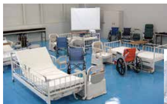
ホームヘルパー科

専門科目は、受刑者の希望に応じて受講させており、資格取得が可能なものや社会での需要が高い種目を選定しています。理容科、医療事務科、ホームヘルパー科、調理科(パン職人)、PC上級科、CAD技術科、建設機械科、点字翻訳科、音訳科、販売サービス科、デジタルコンテンツ編集科の11科目になっています。