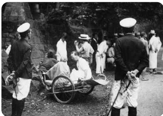
熊本県本妙寺での強制収容 1940年(S15年)