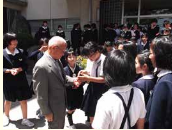
出雲市立高松小学校訪問

療養所入所者の皆さんのふるさとへの想いに応えるため、'ふるさとの名所巡り'や'思い出の場所の見学'などの支援を行っています。