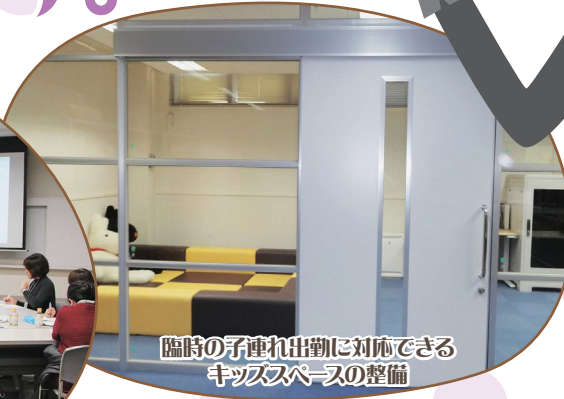
臨時の子連れ出勤に対応できる キッズスペースの整備