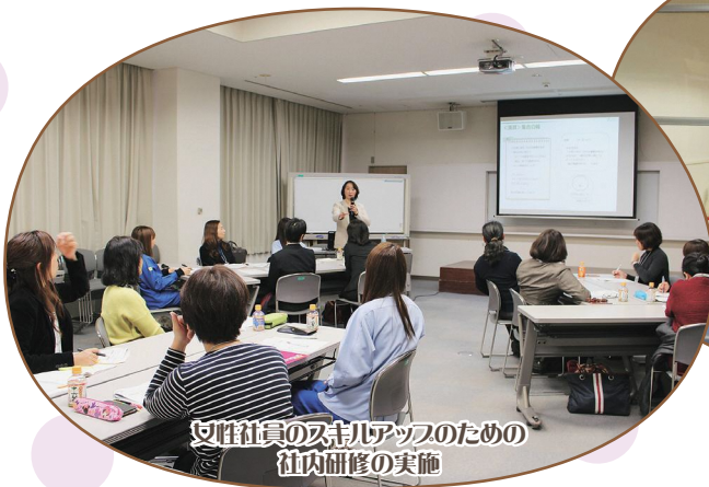
女性社員のため のスキルアップ のための 社内研修の実施