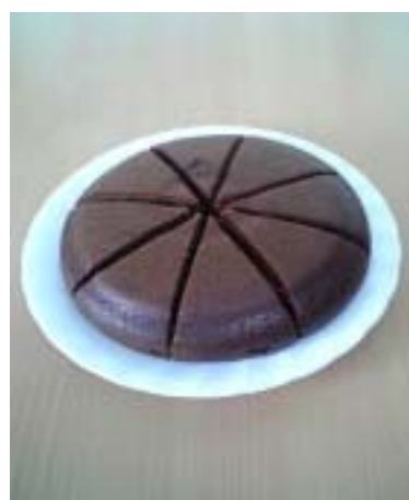
チョコレートケーキ