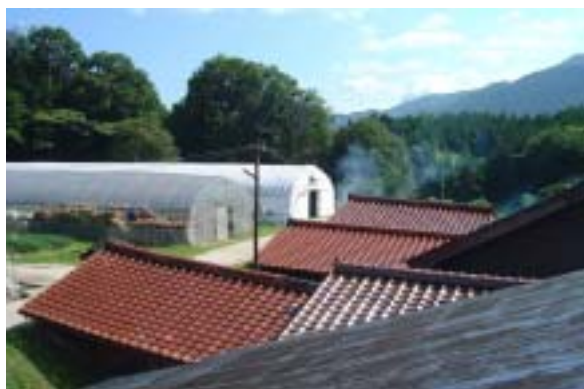
菌床椎茸栽培施設（パイプハウス） 木炭焼成施設...島根八名式木炭生産窯 3基