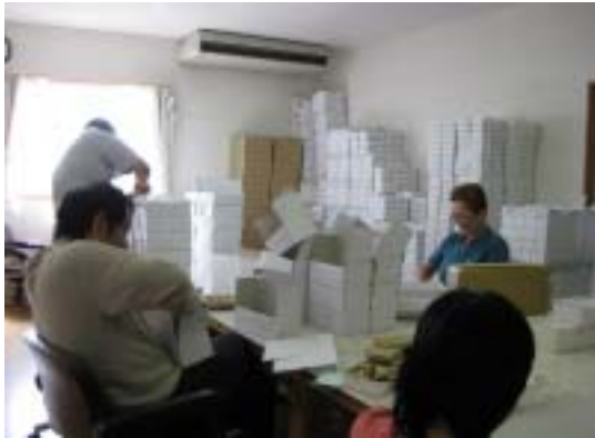
作業風景（サン出雲）