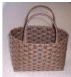
エコクラフトのかばん