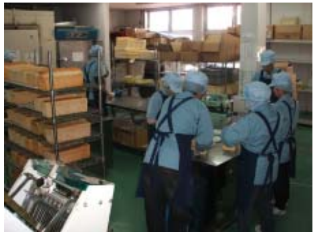
まるベリー-斐川 工房内作業風景