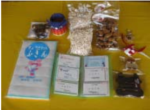
ふきん、クッキー、名刺