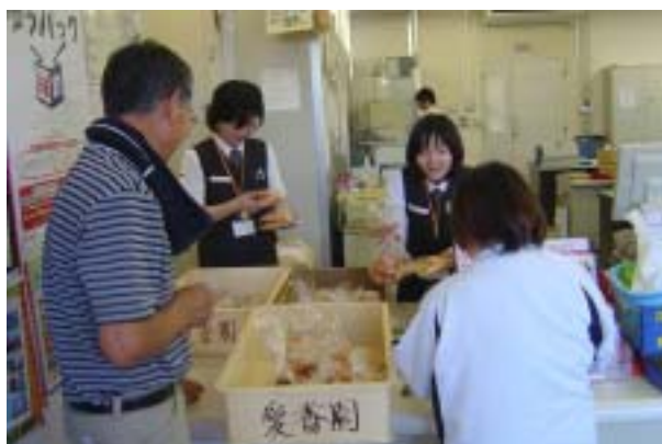
毎日午後から、販路拡大員さんと利用者さんと で、地域の事業所へパン・菓子等の施設製品の訪 問販売を行っています。