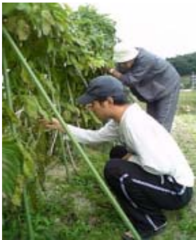
農園での作業風景