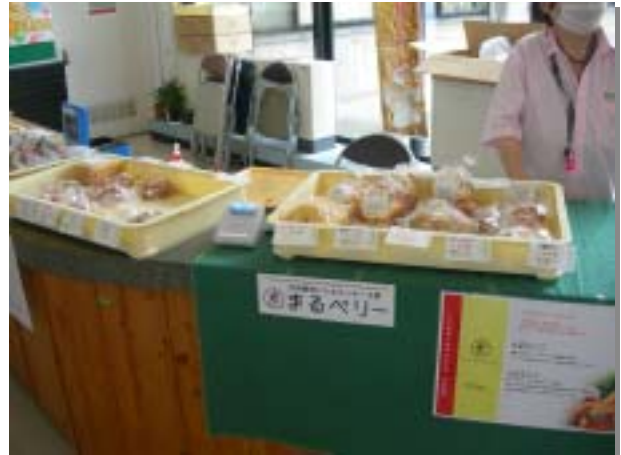
県庁販売すまいる