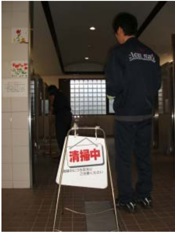
道の駅 ひかわ 作業風景