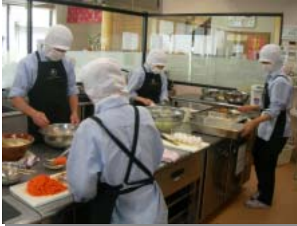
おかげキッチンまるベリー