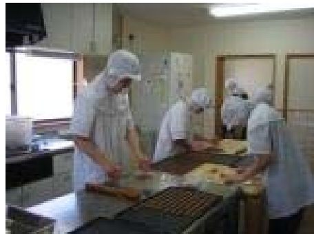
クッキー作り風景