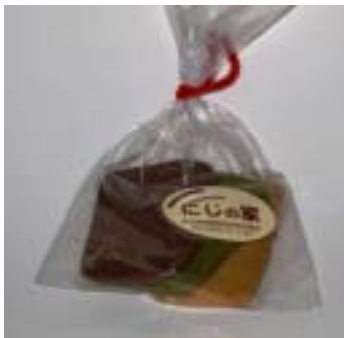
自主製品（クッキー）