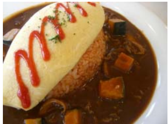
カフェジーノ オムライス