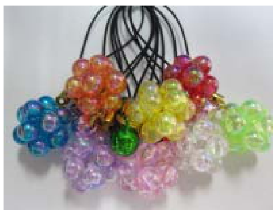
ポンポンストラップ