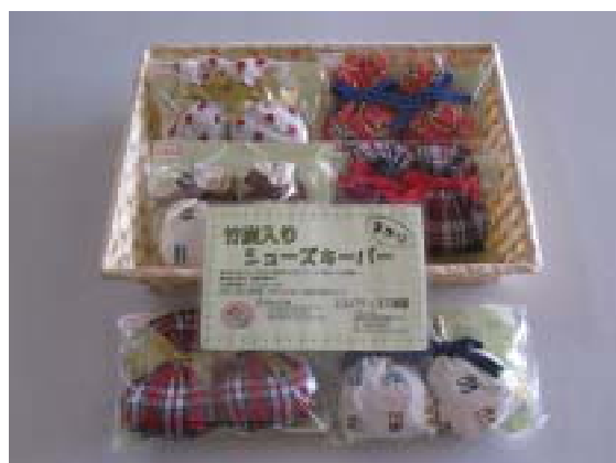
シューズキーパー