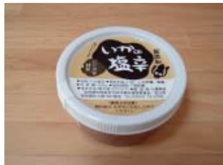
自主製品（いかの塩辛）