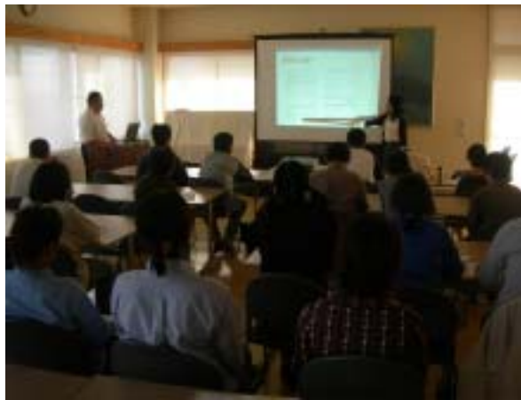
就労支援セミナー