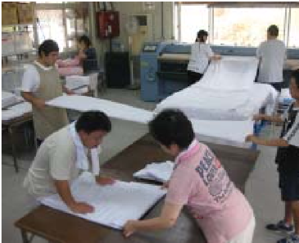
シーツクリーニング