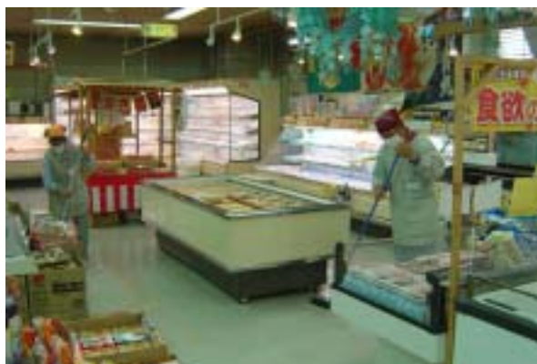
毎日、2人一組で清掃作業を行っています。 （作業時間...8:30～11:30） その他、居宅介護事業所（介護保険）での洗濯・清 掃作業も行っています。