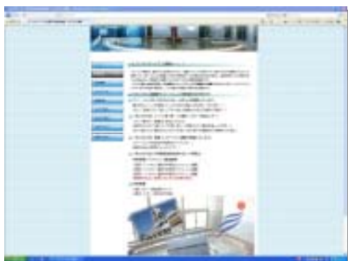
ホームページ作成