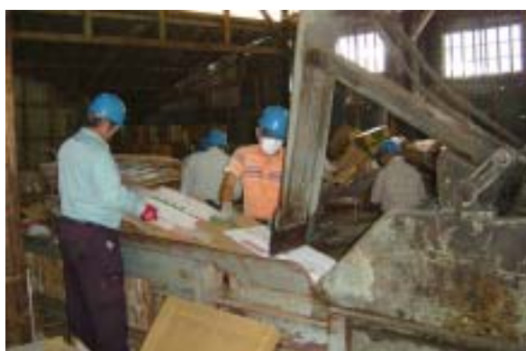
毎週1日～2日、就労移行と就労継続B型の利用 者に分かれてユニットを組んで、リサイクル工場 で作業をしています。