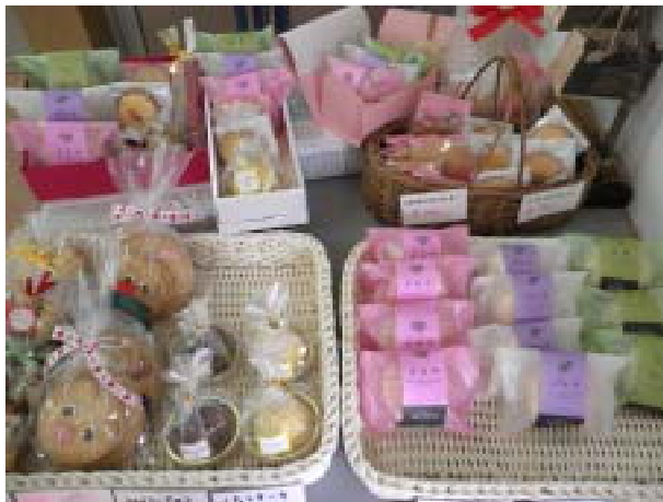
トルティーノ 洋菓子