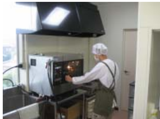
クッキー作り風景