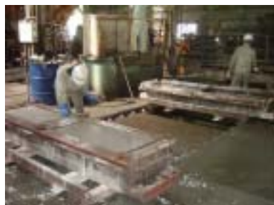
コンクリート製造