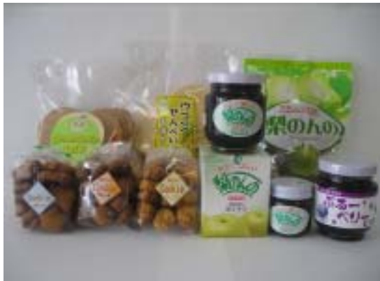
自主製品（クッキーなど）