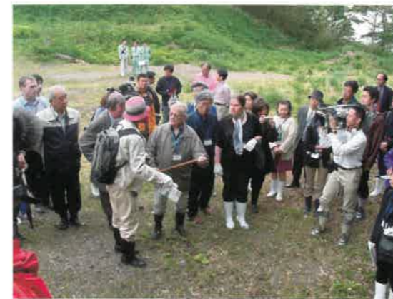
▲石銀藤田地区にて

大森銀山重伝建地区では代官所前から銀山公園まで歩き、途中で修復が進む重要文化財熊谷家住宅等を視察されました。午後には、近代に建設された清水谷製錬所の跡を訪れて斜面に残る石垣の遺構を見ていただいたあと温泉津町に移動し、銀山街道温泉津沖泊道を清水集落から「松山の道標」まで歩き、最後に沖泊集落を見ていただきました。街道の視察途中、専門家から何時作られた道か、街道の道幅に対してどこまで史跡指定されているか、どこまで緩衝地帯を考えているかなど、次々と質問が出ました。そして、石見銀山遺跡の構成資産として街道や港湾まで含めている点について、新しい視点であるとの評価が得られました。