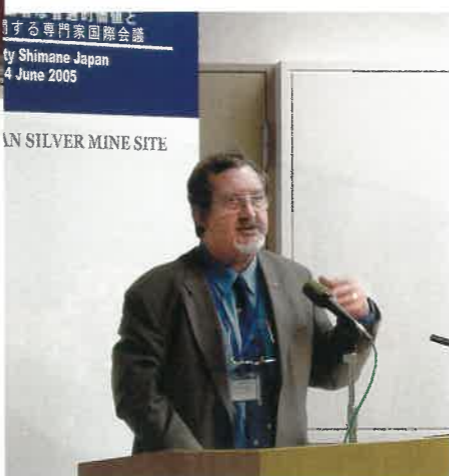
▲スチュアート・B・スミス氏 (国際産業遺産保存委員会事務局長)