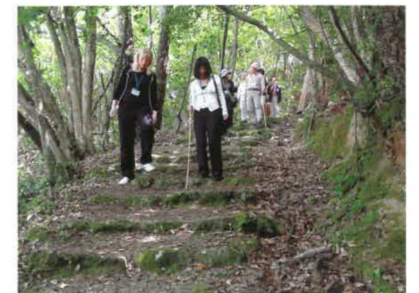
▲石見銀山街道 温泉津・沖泊道にて